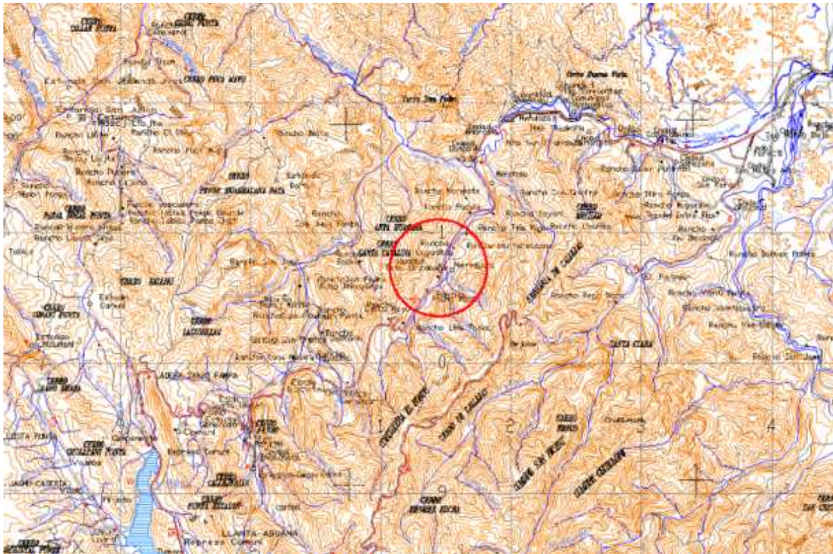
Vista satelital del sitio