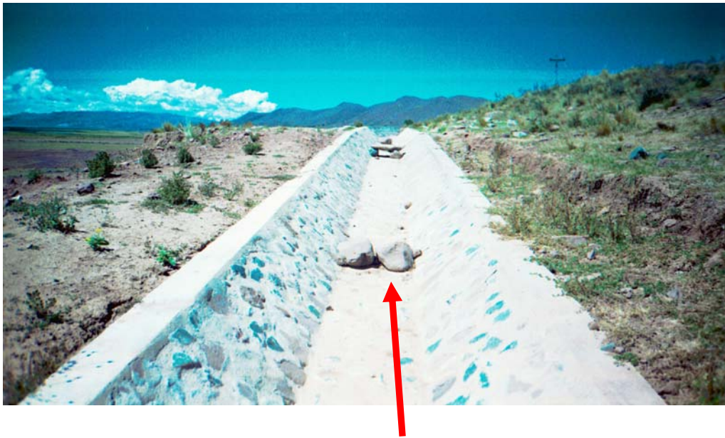
ZANJA DE CORONACION

Las zanjas de coronación son zanjas excavadas en el terreno natural, en la parte superior de los taludes de los cortes, con el fin de interceptar y encauzar el agua superficial que escurre ladera abajo desde mayores alturas, con la función de evitar la erosión de los taludes, el congestionamiento de las cunetas y, por supuesto, la invasión de la plataforma por el agua y el material de arrastre.