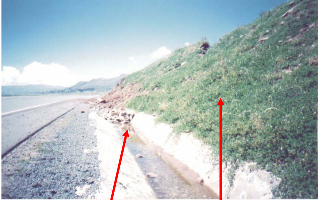
DERRUMBE QUE OBSTRUYE CUNETETA