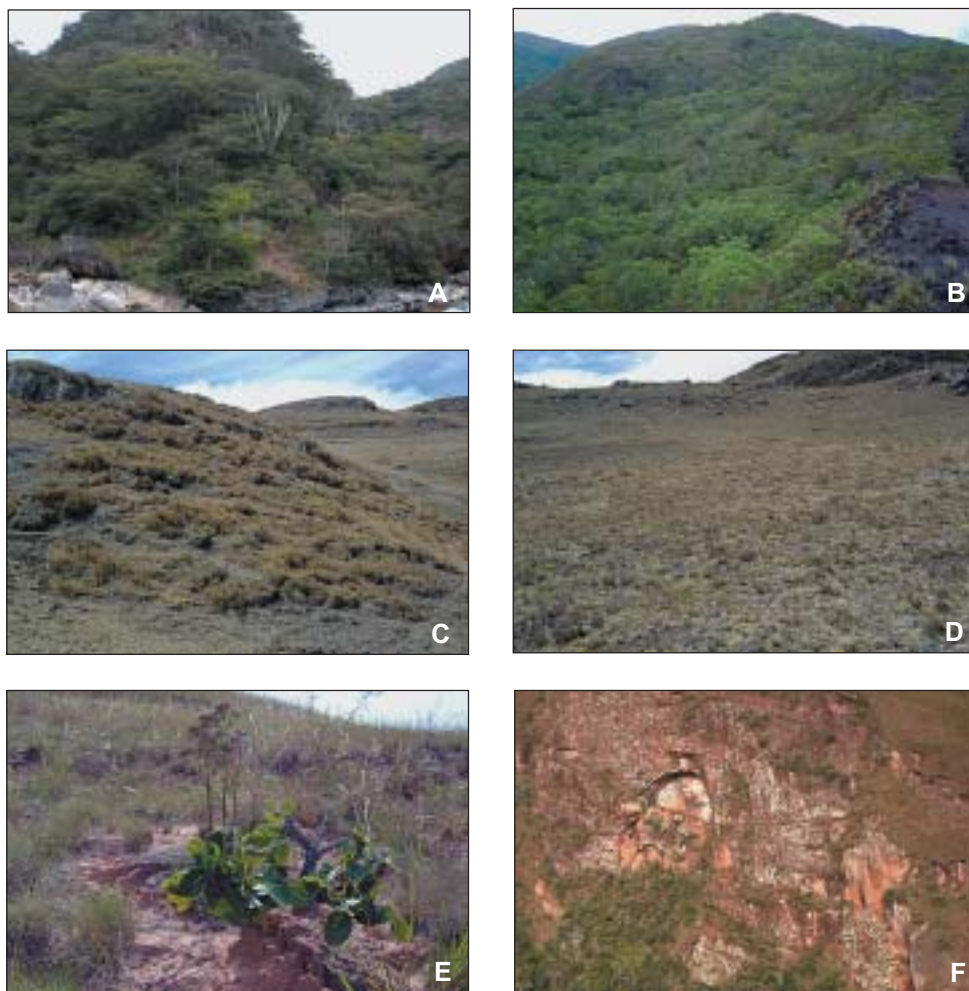
Fig. 3: A: Bosque subandino pluviestacional subhúmedo, río Charazani; B: Cerrado subandino, Virgen del Rosario; C: Pajonal altoandino, Pacobamba; D: Pradera altoandina; Pacobamba; E: Sabana subandina, E de Apolo; F: farallon con vegetación saxícola, E de Apolo.